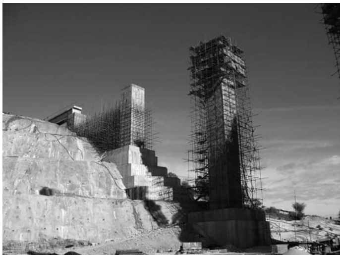
Barrage de Kébir – Tunisie